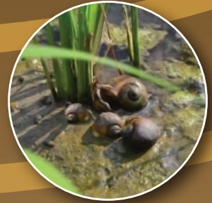
Siput murbei Pomacea canaliculata