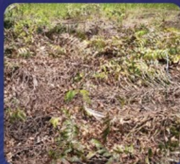
12 MSA (Minggu Setelah Aplikasi)