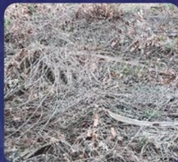
32 MSA (Minggu Setelah Aplikasi)