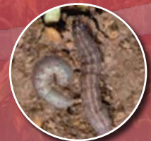
Ulat tanah Agrotis ipsilon